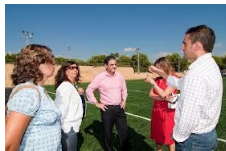
ROSA MONTERO, Te trataré como a una reina.